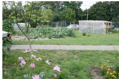
De Graafse Hof